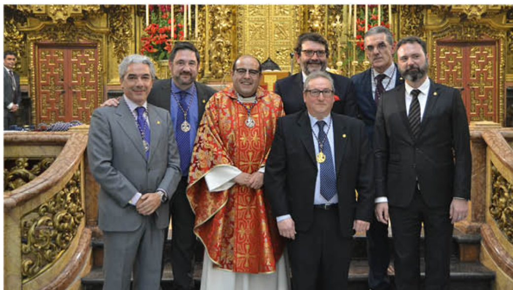
HOMENAJE E IMPOSICIÓN DE INSIGNIA DE ORO A LOS EX HERMANOS MAYORES