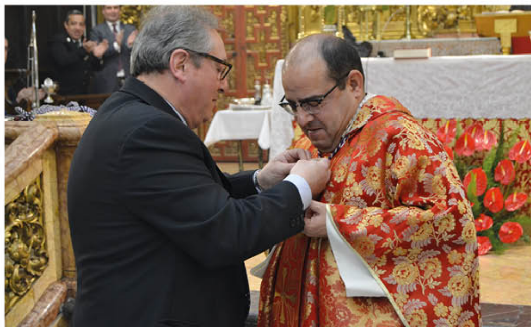
HOMENAJE E IMPOSICIÓN DE LA INSIGNIA DE PLATA DE LA HERMANDAD A NUESTRO CONSILIARIO