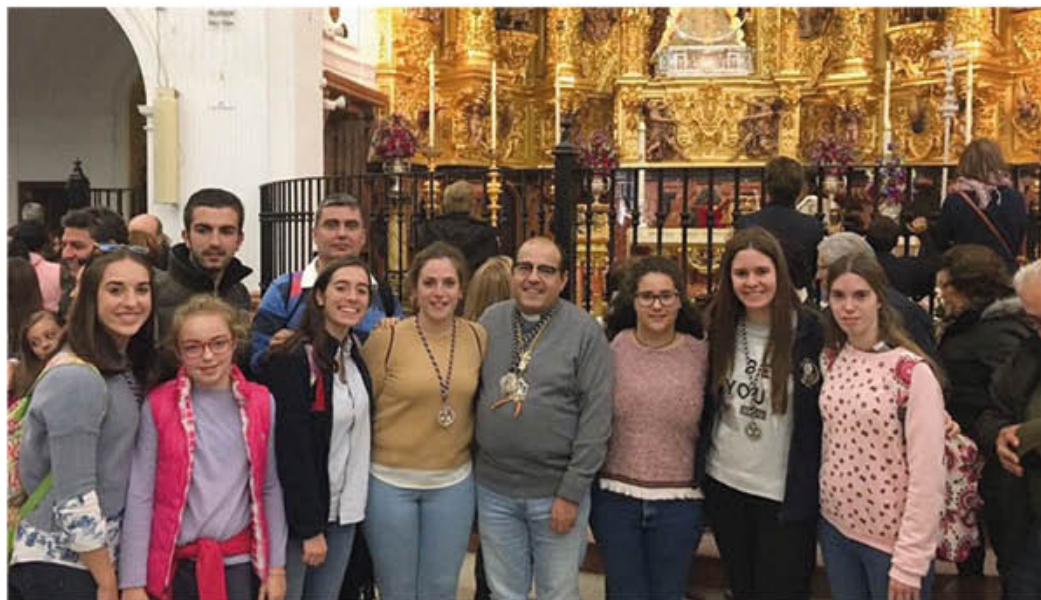
CONVIVENCIA EN EL ROCÍO DEL GRUPO JOVEN