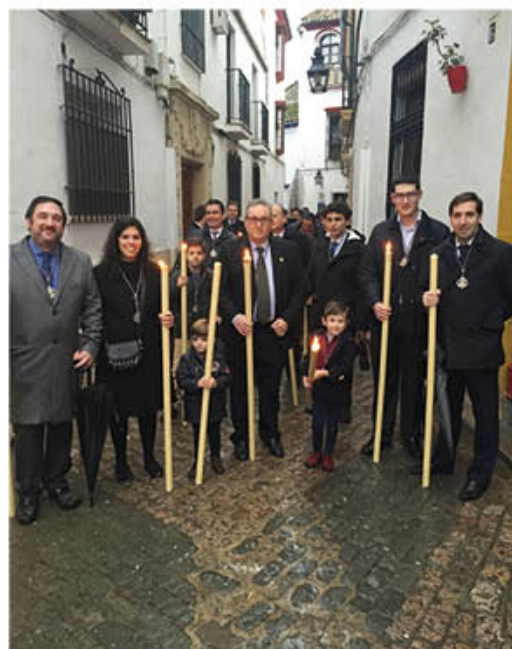
REPRESENTACIÓN VÍA CRUCIS DE LAS HERMANDADES