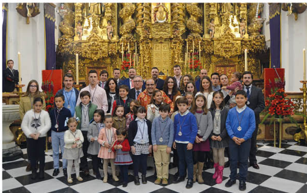
IMPOSICIÓN DE MEDALLAS 2016