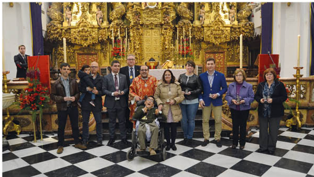
HOMENAJE 25 ANIVERSARIO COMO HERMANOS