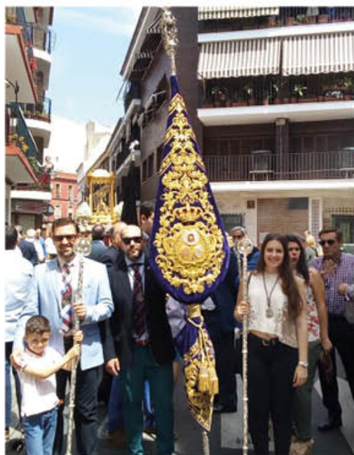
REPRESENTACIÓN CORPUS DE LA PARROQUIA