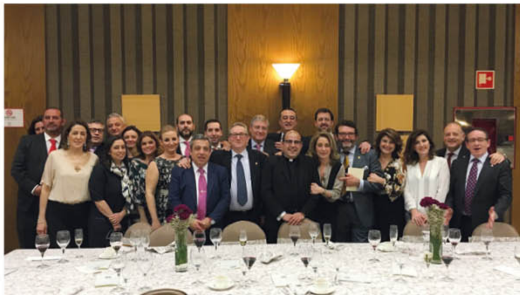
REPRESENTACIÓN CENA HOMENAJE AL PREGONERO DE LA SEMANA SANTA 2016